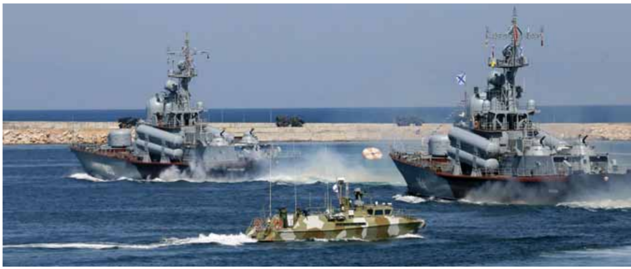
من عرض يوم البحرية في ميناء سيفاستوبول على البحر الأسود

أعلن الرئيس الروسي، فلاديمير بوتين، أمس الأحد، أن الأسطول الروسي جاهز لردع أي عدو. وقال بوتين في كلمة ألقاها أثناء الاستعراض العسكري البحري بمناسبة يوم الأسطول الروسي في سان بطرسبورغ: «يضمن أسطولنا البحري بشكل ثابت أمن بلادنا ومصالحها الوطنية، وهو قادر على صد أي عدو كان». وأضاف: «سنقوم في المستقبل ببناء أسطول نادر من حيث قدراته، وهذا هو أسطول الدولة القوية ذات السيادة». وأشرف الرئيس بوتين، على الاستعراض العسكري البحري الرئيسي الجاري في مدينة سان بطرسبورغ الروسية. وشارك في المراسم الاحتفالية بمناسبة يوم الأسطول الروسي الذي تحتفل البلاد به العام بالذكري ٢٢٣٣ لتأسيسه. ومن بوتين على متن قارب بالخط الأممي للسفن العسكرية المشاركة في الاستعراض في مياه الخليج الفلندي بالقرب من مدينة كرونشتاد. وكان بوتين أشار خلال إشرافه على تفتيش لأحد تكريم ذكرى شهداء البحرية إلى أن روسيا لا تنسى أبطلها أبداً. هذا وجرى أمس في مدينتي سان بطرسبورغ وكرونشتاد الروسيين الاستعراض العسكري البحري بمناسبة يوم الأسطول الروسي. وشارك في الاستعراض الغواصة «ستاري أوسكول»، والفرقاطة