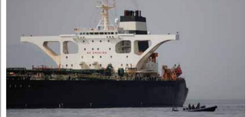
ناقلة النفط الإيرانية المحتجزة في مضيق جبل طارق

قال الرئيس الإيراني حسن روحاني أمس الأحد إن المصدر الرئيسي للتوتر في الخليج هو وجود قوات أجنبية وذلك في تصريحات أدلى بها خلال اجتماع مع وزير الشؤون الخارجية العماني يوسف بن عوي في طهران بحسب ما نقل الموقع الرسمي للرئاسة الإيرانية على الإنترنت. وقال روحاني: «وجود القوات الأجنبية لن يساعد الأمن في المنطقة بل سيكون المصدر الرئيسي للتوتر» مشيراً إلى أن المسؤولية الأساسية لتأمين مضيق هرمز تقع على عاتق إيران وسلطنة عمان.